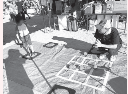
<ポッチャでビンゴ!の様子>

地域の行事に参加させていただく機会は貴重ですので、今後も大切にしていきたいと思っております。ありがとうございました!