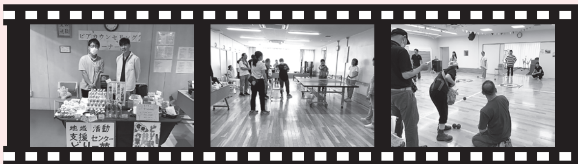
手をつなぐ夏の夕べの様子