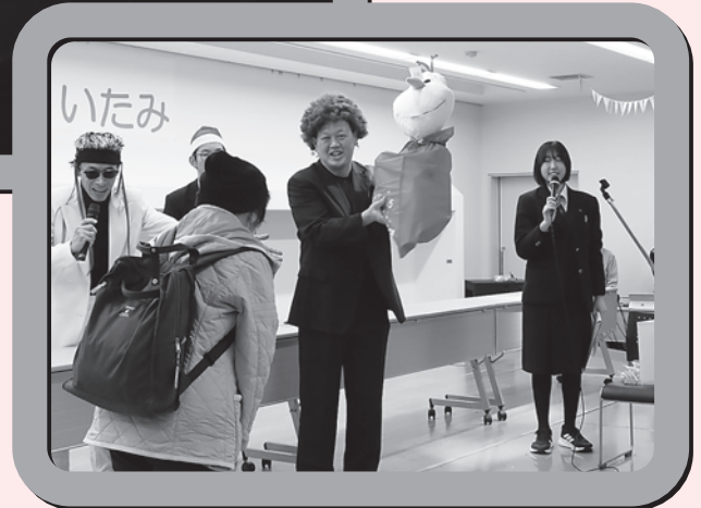
フェスタ・イン・いたみの様子