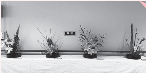
デイサービスセンター (あいあいグループ、にこにこグループ、わくわくグループ)

絵手紙、おとなのぬり絵、アトリエカラフル、クラフトを楽しもう、書の苑、陶芸、華道、押し花教室より