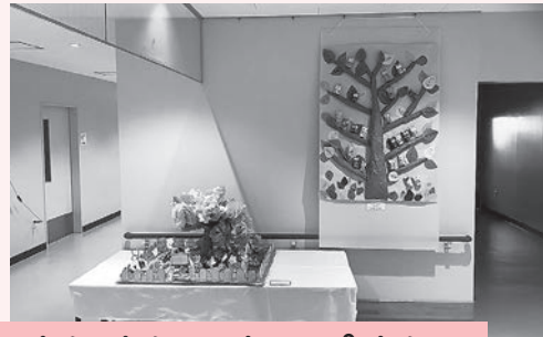
アイ愛カルチャー教室

絵手紙、おとなのぬり絵、アトリエカラフル、クラフトを楽しもう、書の苑、陶芸、華道、押し花教室より