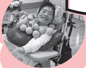
誰もが頑張った!! スポーツ大会