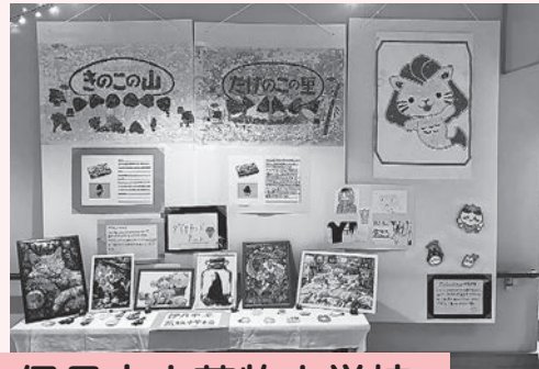
伊丹市立荒牧中学校