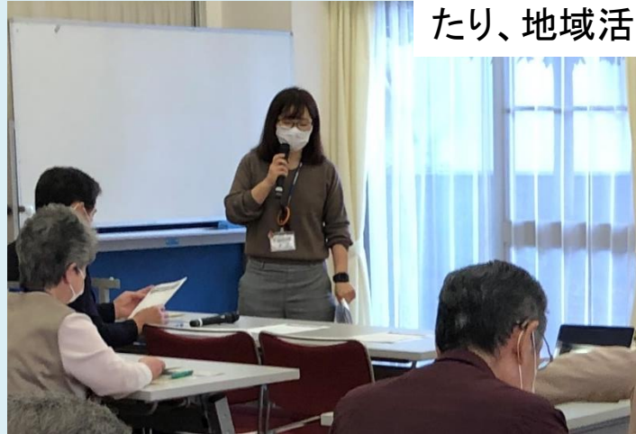
地域での訪問の様子

A 大学卒業後は、高齢者介護施設に勤務していましたが、入居者の方から地域での暮らしの思い出や「やっぱり自分の家が一番」という声を伺ううちに、地域での生活をサポートしたいなと次第に思うようになり、また大学で社会福祉について学んだことを活かさないかと考え、社協に入職したいと思いました。